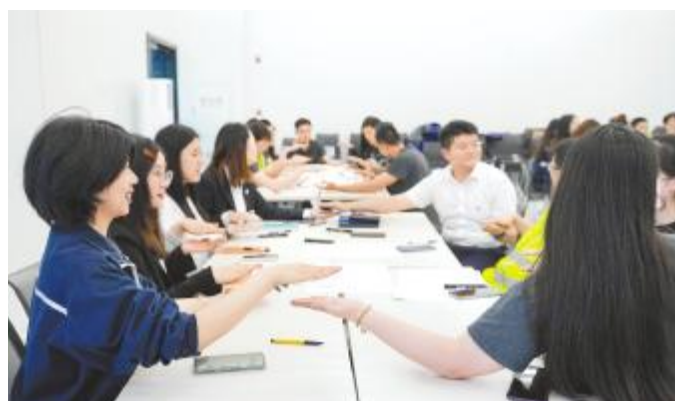
通威太阳能科技心理健康团体沙龙游戏互动环节