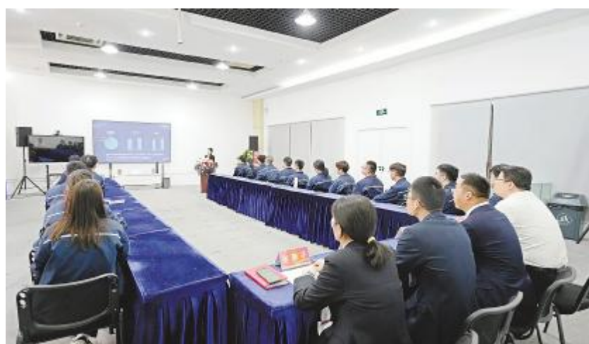
通威太阳能科技合肥基地举行2023届启航员工一季度学习汇报会