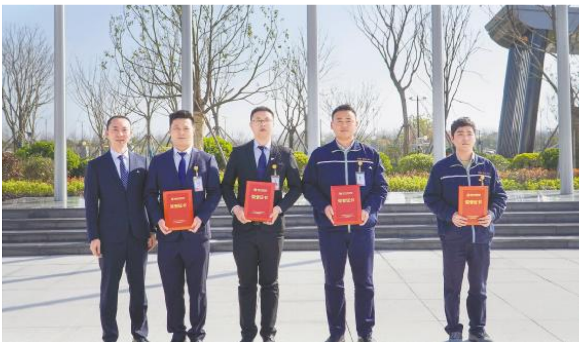
通威太阳能科技盐城基地表彰3月企业文化之星

各部门领导针对启航生汇报表现及后续发展规划予以点评,鼓励大家以高标准要求自己,以提升工作能力为导向,多学习、多思考、多请教,提升个人实力与竞争力。