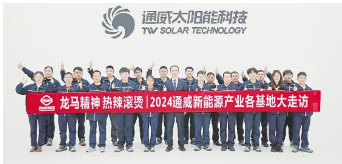
“2024年通威各产业基地大走访活动”走进通威太阳能科技盐城基地合影留念