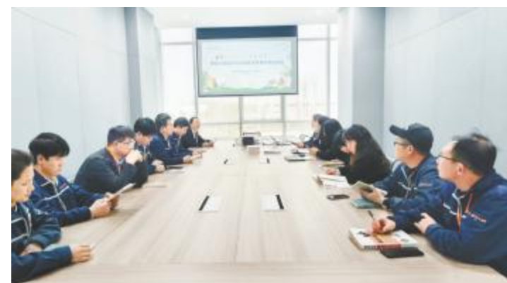
通威太阳能科技盐城基地举行读书分享活动