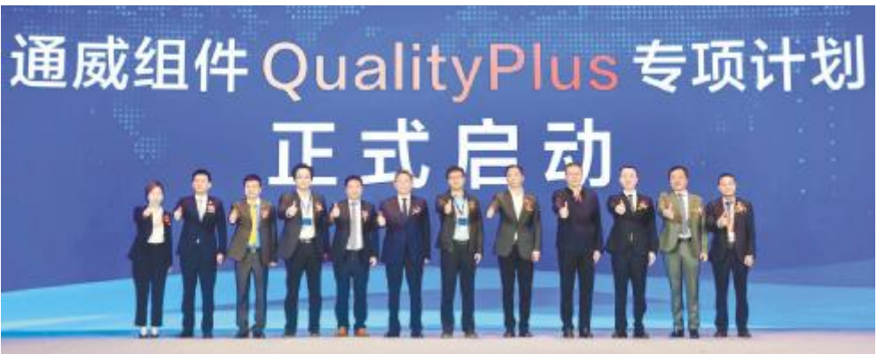
通威组件 Quality Plus 专项计划正式启动