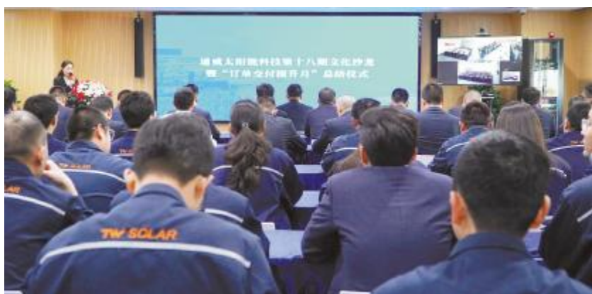
通威太阳能科技盐城基地活动现场

萧总在讲话中指出,2024年是全球光伏产业新一轮转型的关键节点,在优胜劣汰的激烈竞争中,想要穿越低谷、跨越周期、引领未来,需要全体同仁凝心聚力,苦练内功。管理干部要以身作则,明确对内对外的要求和态度,清楚组织价值,推动员工始终如一践行企业文化与行为准则,最终形成各环节各层级齐头并进、共同发力的蓬勃态势。希望公司上下以本次活动为契机,为订单的保质保量交付继续努力奋斗。