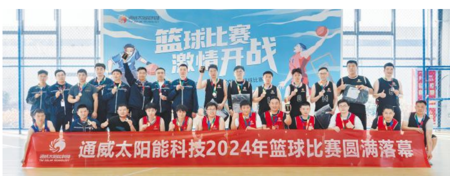
通威太阳能科技盐城基地篮球比赛合影留念

企业文化不是空中楼阁,它从平常的每件事、每句话、每个行为中得以体现,是员工不经意的思考与行为,并植根于每个人的内心。它真正赋予了企业持久发展的方向、奋勇前行的目标、待人行事的作风和创造财富的意义。为丰富员工文化生活,通威太阳能科技组织开展心理健康团体沙龙、企业文化之星表彰、篮球比赛、读书分享会、员工DIY等丰富多彩的活动,提升员工幸福感,进一步增强凝聚力、战斗力,持续赋能通威组件事业发展。