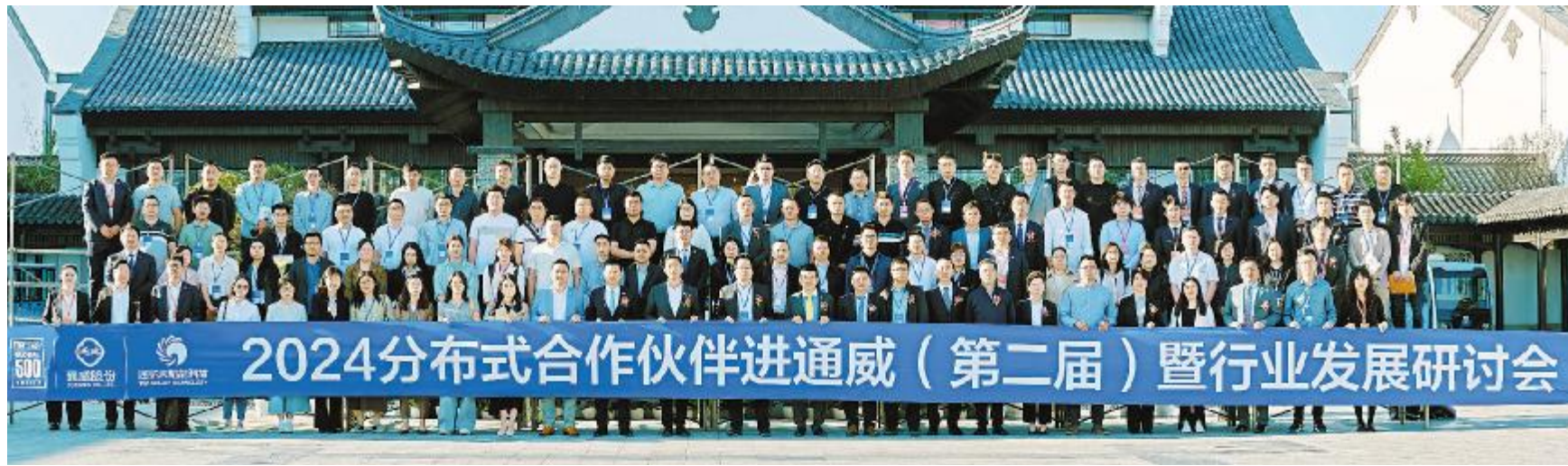
2024 分布式合作伙伴进通威(第二届)暨行业发展研讨会成功举行