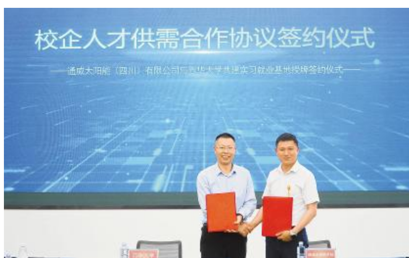
通威太阳能科技金堂基地与西华大学签订校企人才供需合作协议

南通基地班组赋能提升项目分4期滚动式授课,现场气氛活跃,学员们积极作答。南通基地各组件厂厂长、人力资源部副部长现场指导,班组长们更加深入了解生产管理要求,提高自身管理水平,同时加深了对企业文化的理解,将其内化于心、外化于行。