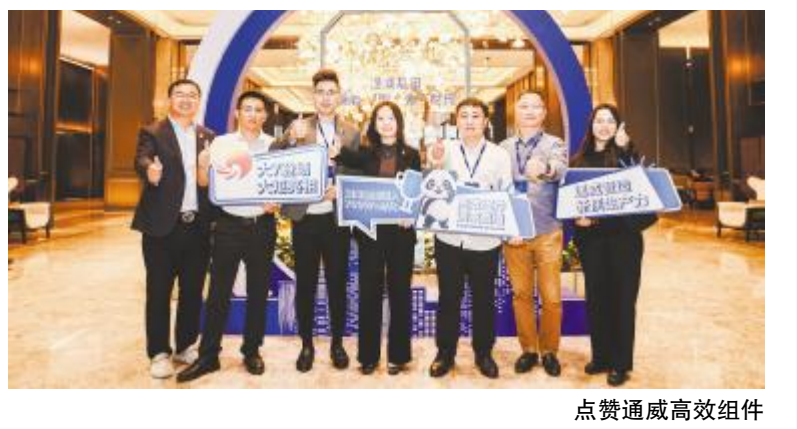
点赞通威高效组件