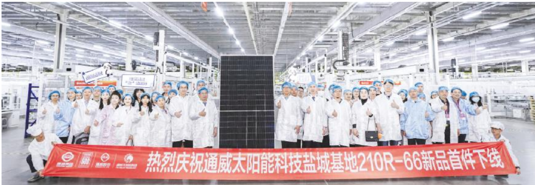
通威太阳能科技盐城基地首件 TNC-G12R-66 版型组件成功下线