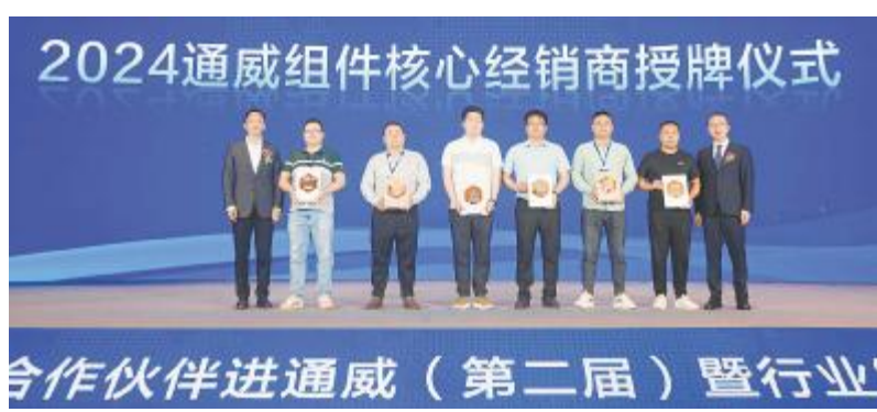
通威组件核心经销商授牌仪式现场