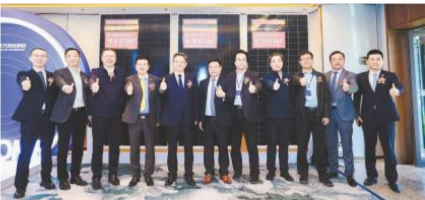
领导嘉宾合影留念

本报讯(记者 钟继辉)4月26日,2024 分布式合作伙伴进通威(第二届)暨行业发展研讨会在江苏盐城隆重举行。来自全国各地的100余家分布式业务核心企业、行业专家、行业媒体近300人齐聚一堂,通过实地参观、主题分享、圆桌对话、质量宣讲、产品推介等丰富活动,切身感受通威发展实力,赋能分布式光伏行业高质量发展。