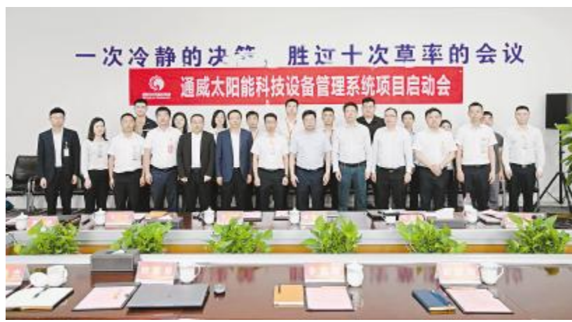
通威太阳能科技设备管理系统项目启动会合肥基地合影留念