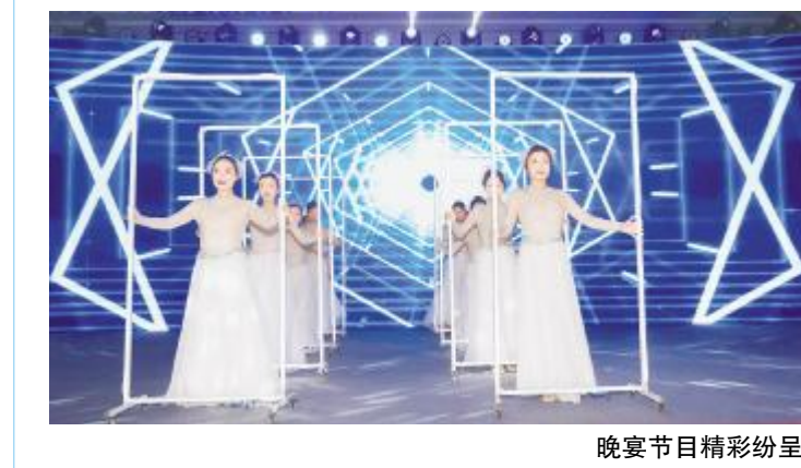
晚宴节目精彩纷呈

品质基因,为客户提供更多的附加值。围绕“分布式光伏高质量发展创新发展”主题,行业专家、企业代表展开圆桌对话,现场智慧碰撞,精彩纷呈。同期,大会还向通威组件核心经销商进行授牌,携手共赴分布式光伏美好未来。大会期间,还举行了答谢晚宴,精彩纷呈的歌舞节目,激动人心的现场抽奖,地道美味的佳肴,热烈的气氛萦绕现场。