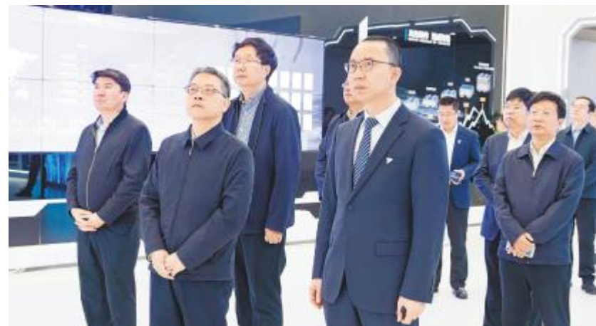
安徽省宣城市考察团参观盐城基地