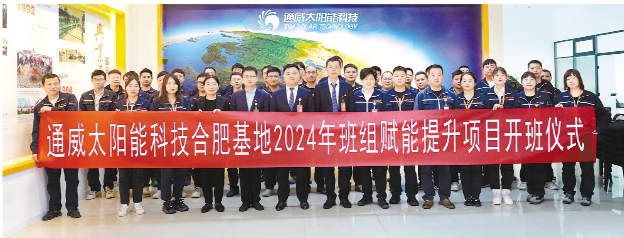
通威太阳能科技合肥基地2024年班组赋能提升项目开班仪式