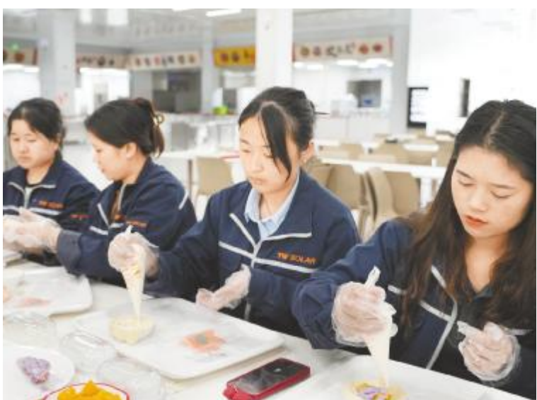
通威太阳能科技金堂基地举行DIY活动

企业文化不是空中楼阁,它从平常的每件事、每句话、每个行为中得以体现,是员工不经意的思考与行为,并植根于每个人的内心。它真正赋予了企业持久发展的方向、奋勇前行的目标、待人行事的作风和创造财富的意义。为丰富员工文化生活,通威太阳能科技组织开展心理健康团体沙龙、企业文化之星表彰、篮球比赛、读书分享会、员工DIY等丰富多彩的活动,提升员工幸福感,进一步增强凝聚力、战斗力,持续赋能通威组件事业发展。