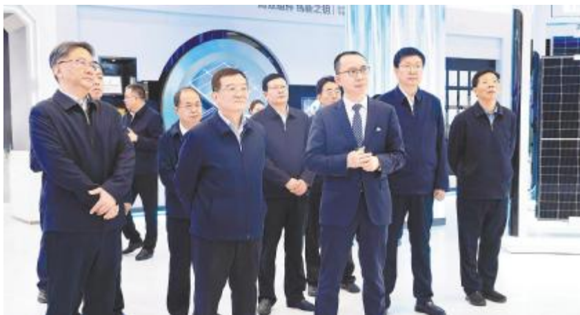
中央统战部副部长、全国工商联党组书记徐乐江调研盐城基地