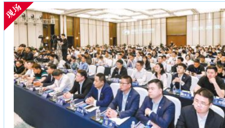
大会现场,嘉宾云集