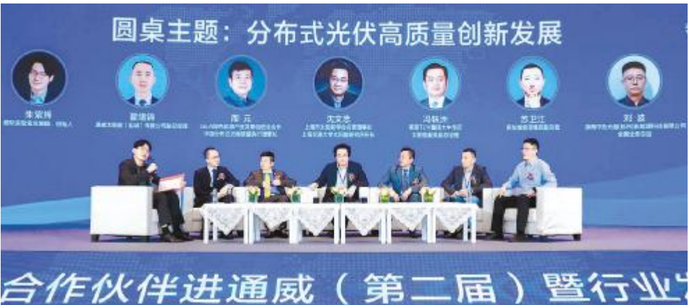
圆桌对话,赋能行业高质量创新发展