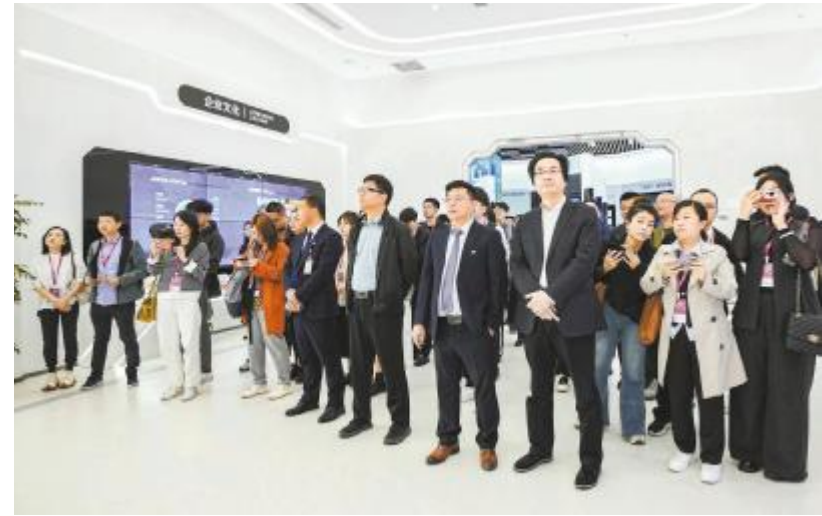
参会嘉宾参观通威太阳能科技盐城基地