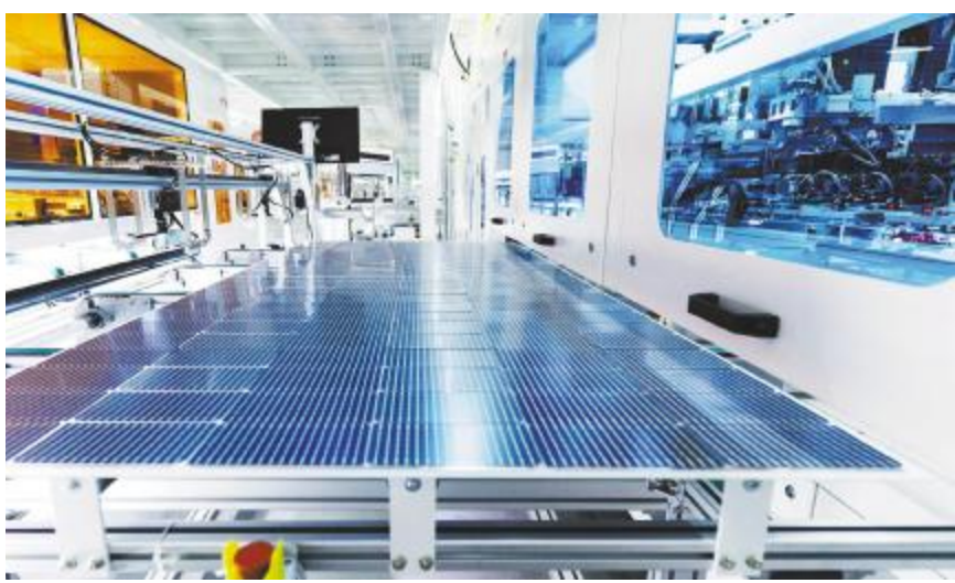
通威太阳能科技盐城基地智能制造生产线