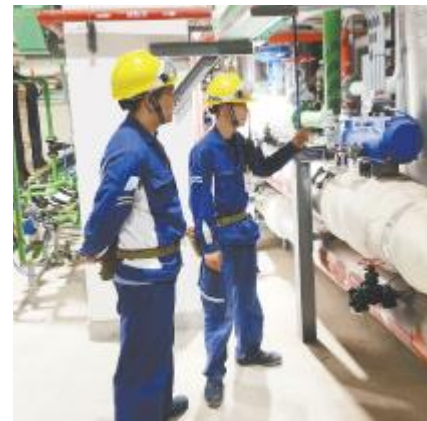
永祥能源科技车瑜