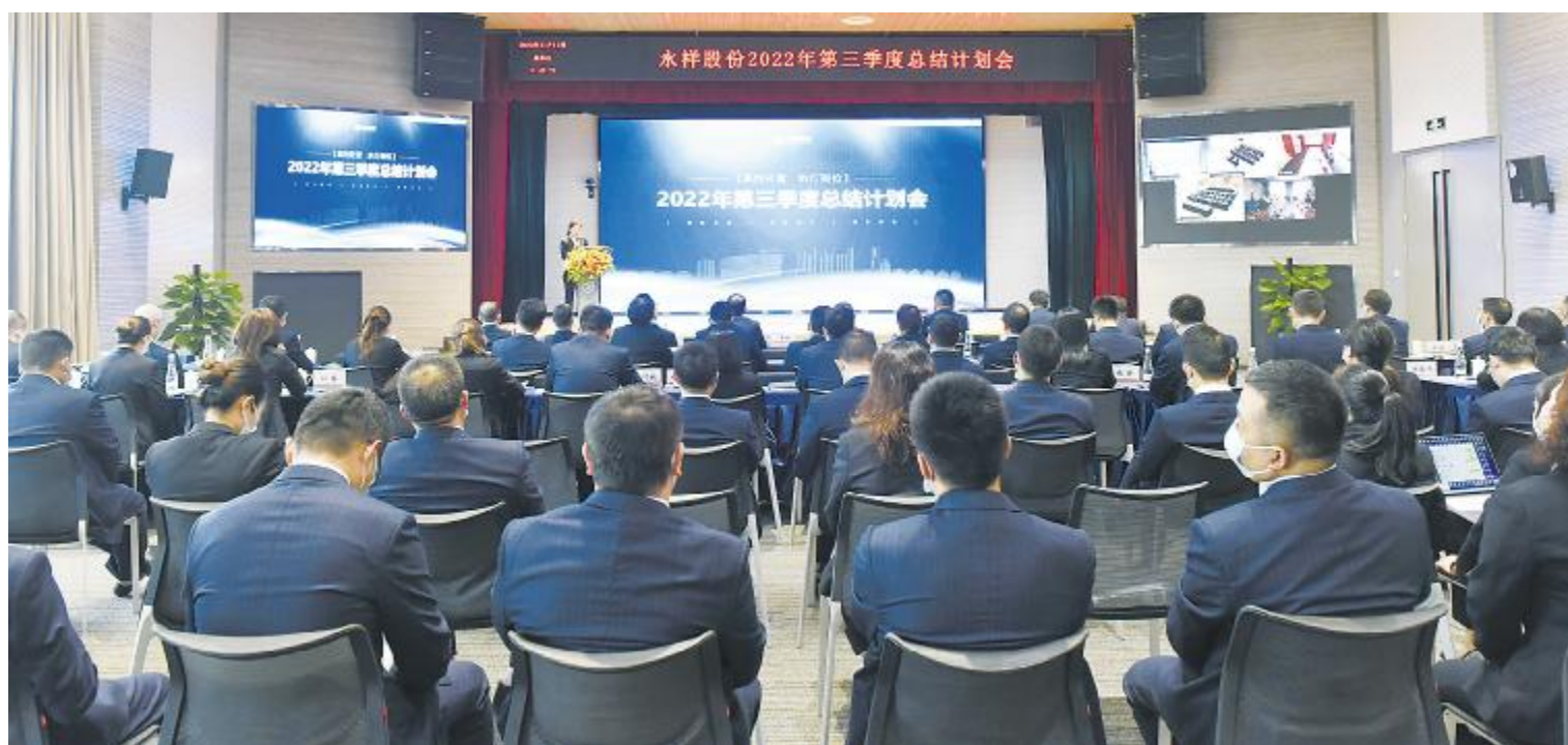
永祥股份2022年第三季度总结计划会现场

记者 刘奕锋 通讯员 王敏 杨彦超 林心喻 郭振 胡尧 吕亚群 陈欣悦 范紫萍 刘召伦 李文慧