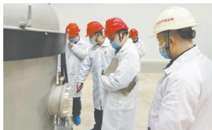
永祥光伏科技施工尾项安全大检查