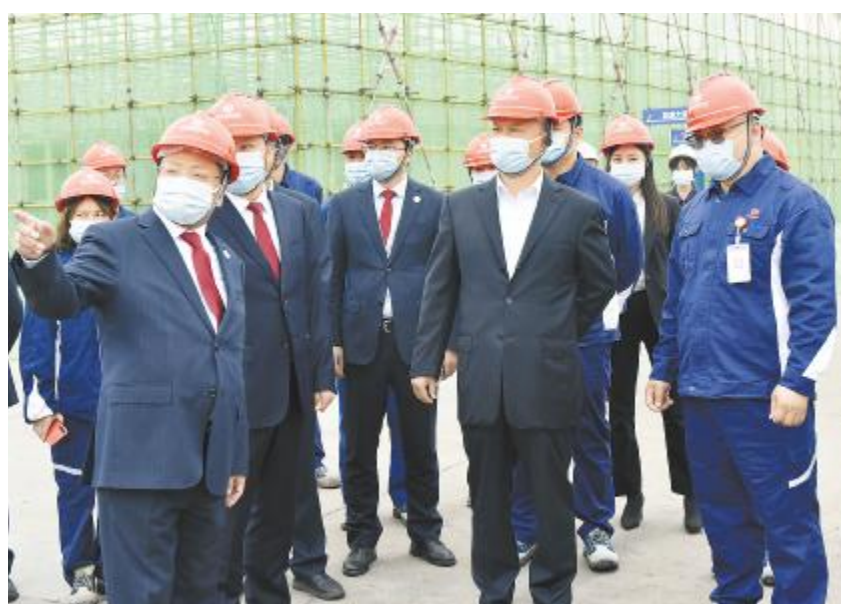
刘汉元主席视察永祥能源科技一期项目

20年的研发成果,将着力打造“成本最优,人效更高,各项指标全球最领先的智能化、智慧化、数字化的全新5G工厂”。干部员工士气高涨,人才引进、梯队建设、科技创新、合规化等工作均有思路、有目标、有措施,在标准引领下有序开展。