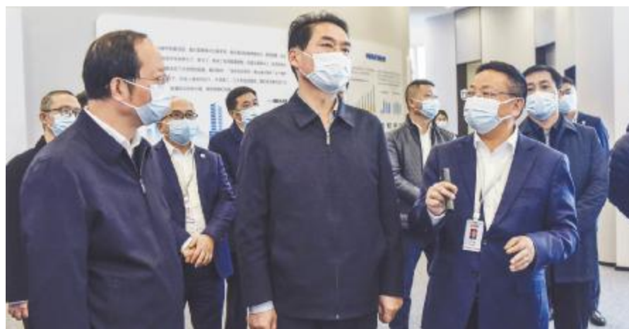
四川省委常委、统战部部长、省总工会主席赵俊民莅临永祥股份调研