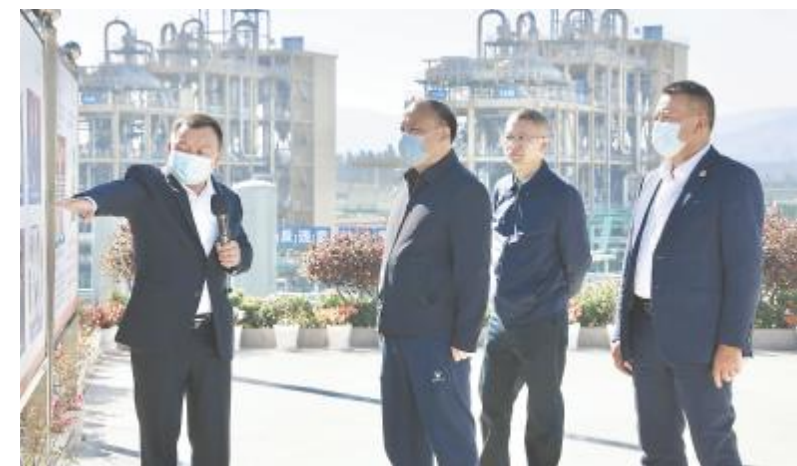
青海省副省长杨逢春莅临云南通威调研