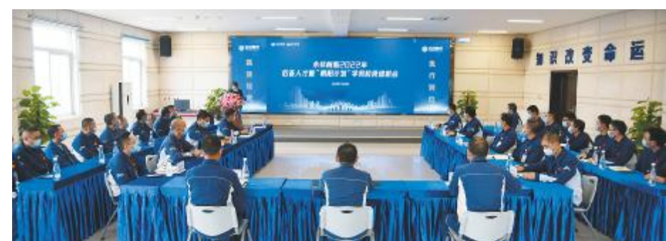
永祥树脂召开2022年后备人才暨“朝阳计划”学员阶段述职会