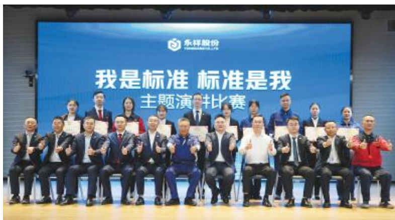
永祥股份“我是标准 标准是我”主题演讲比赛合影留念

使命记于心,标准践于行。多年的标准化让永祥人的脚步更加坚定,完备的标准化体系让我们有信心守住安全,有信心保住质量,有信心守住市场,有信心应对一切挑战!渔光同辉,未来已来!我们相信,在基业长青的通威创变之路,永远会有永祥人躬身笃行的身影!