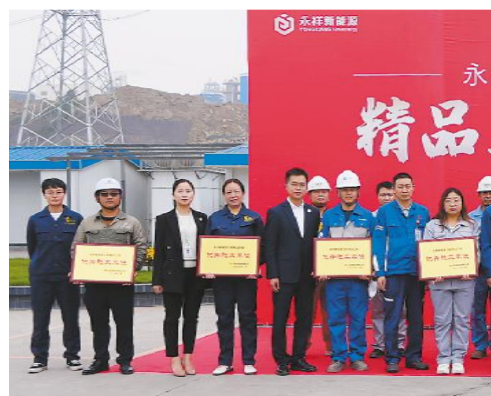
永祥新能源举行二期精品工程表彰会