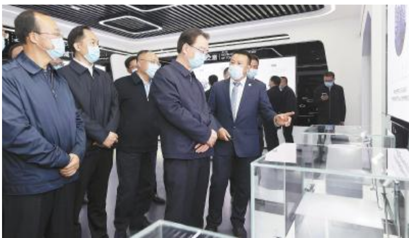
云南省委书记王宁莅临云南通威考察