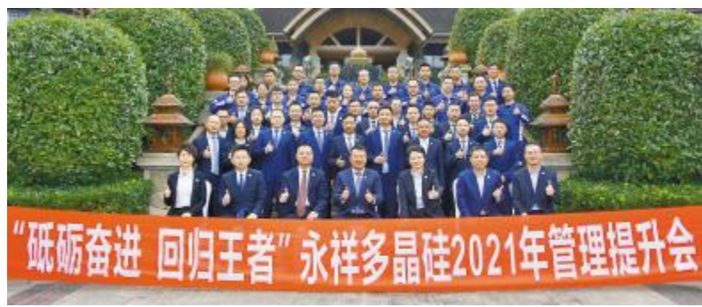
永祥多晶硅2021年管理提升会合影留念