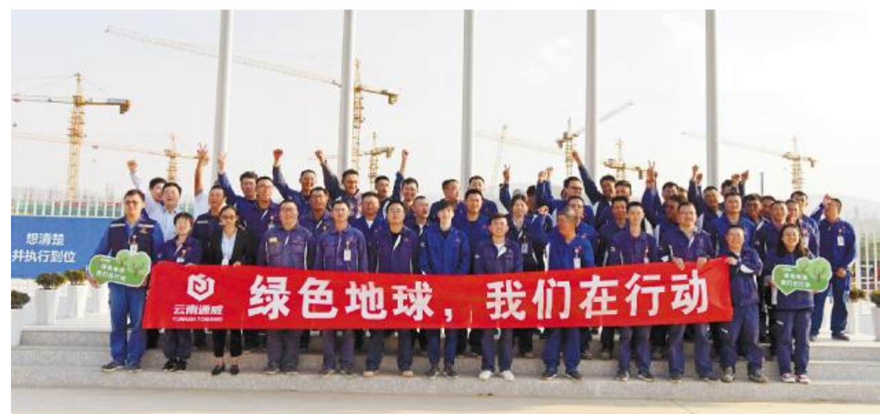
云南通威高纯晶硅举行环保知识讲座

4月22日是世界地球日,这个在1970年由美国的盖洛德·尼尔森和丹尼斯·海斯发起的公益活动,如今已发展成为一项世界性的环境保护运动。旨在唤起人类爱护地球、保护家园的意识,促进资源开发与环境保护的协调发展。