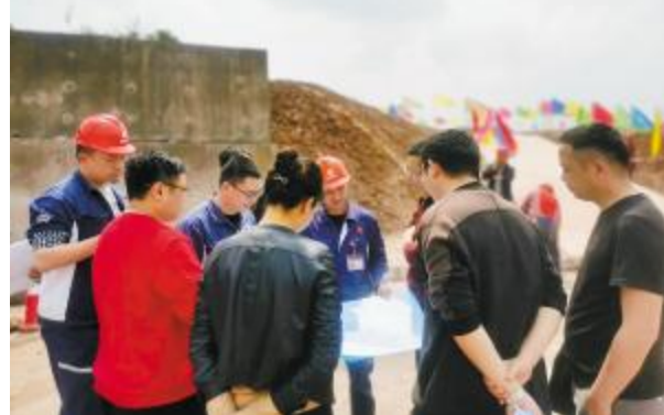
永祥光伏科技顺利通过环境影响评估报告专家评审