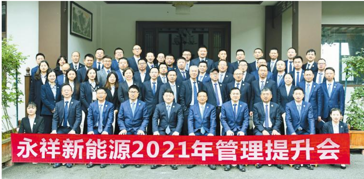
永祥新能源2021年管理提升会合影留念

记者 唐黄之 通讯员 程凤涛 钟金梅 刘召伦 陈明江 陈丹蕊 曾艳 周海容 卢小兰 陈洁 田晨怡 许文娟 林心喻