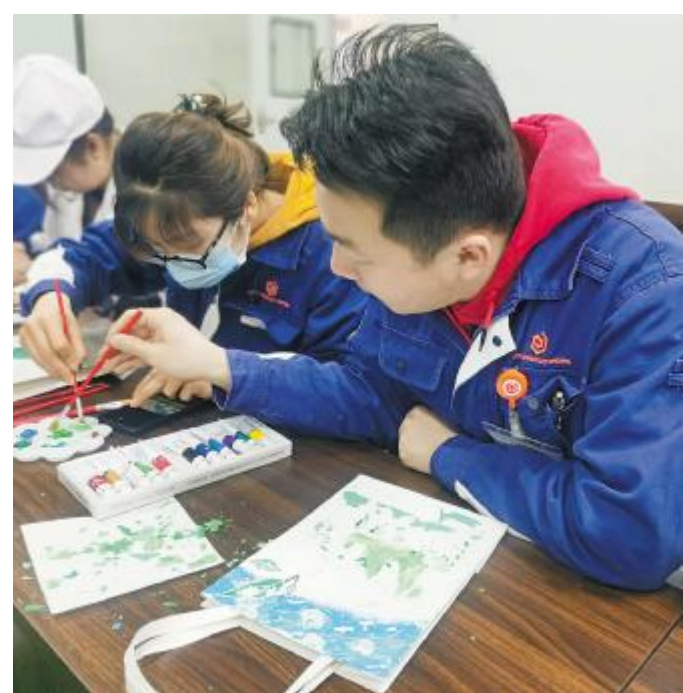
内蒙古通威高纯晶硅开展环保袋涂鸦比赛