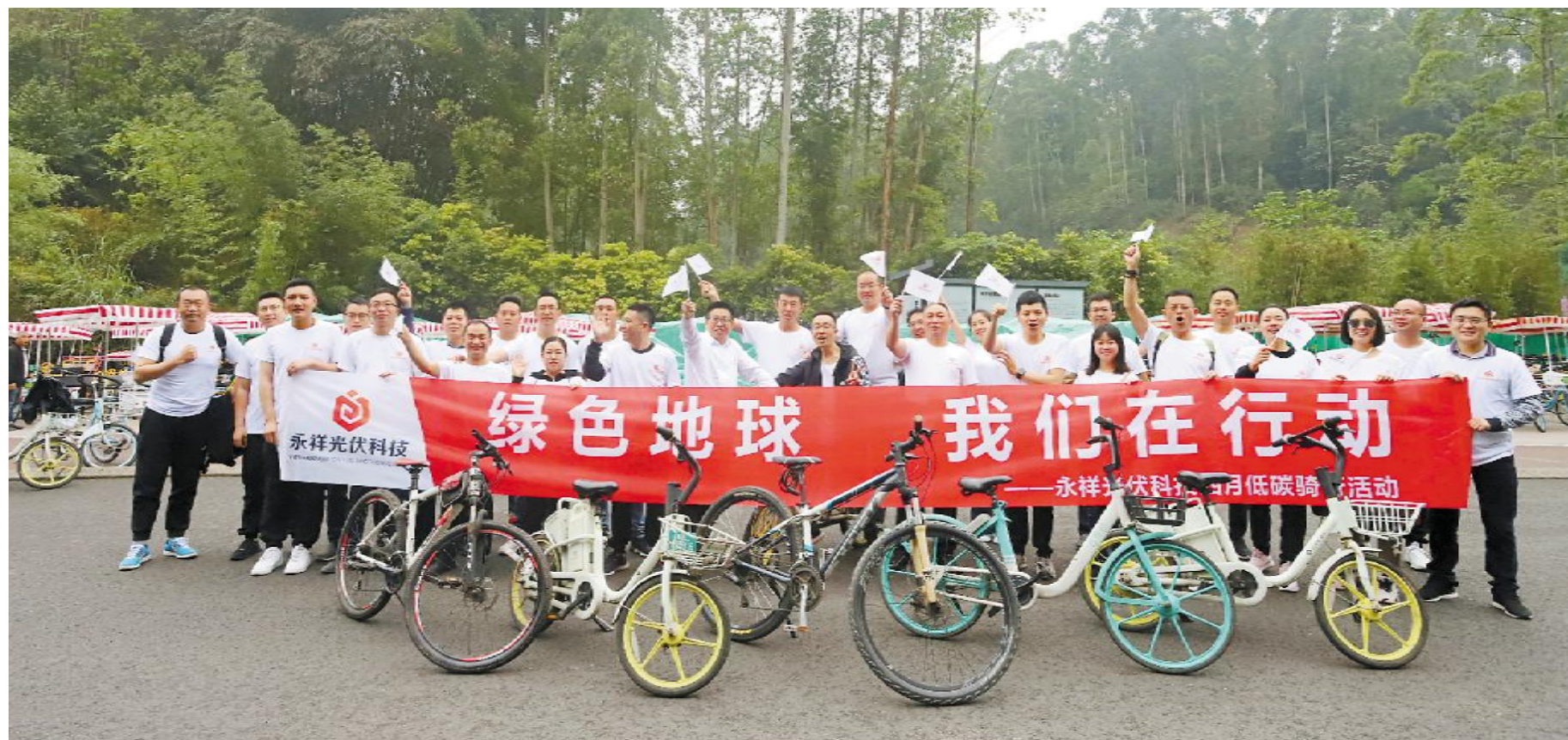
永祥硅材料、永祥光伏科技开展低碳骑行活动