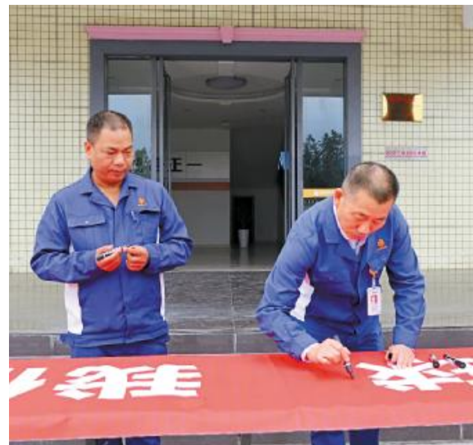
永祥新材料举行环保倡议签字仪式