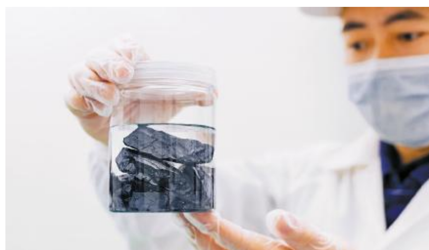
永祥一直坚持技术创新,已实现产品质量、工艺技术、能耗指标行业领先

低碳生活托起明天,让我们携手同行,秉承低碳环保理念,倡导践行绿色出行方式,为子孙后代留住青山绿水、白云蓝天作出自己的一份贡献!