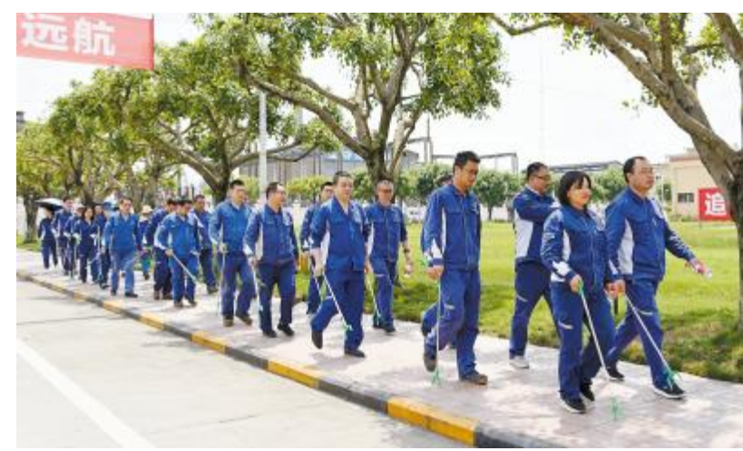
永祥树脂组织员工步行前往菩提山开展“捡拾垃圾,宣传环保”活动

今年是第52个世界地球日,主题为:“珍爱地球,人与自然和谐共生”。借助地球日活动,永祥股份开展一系列丰富多彩的企业文化活动,提高全体干部员工对资源国情的认识,引导全员积极节约资源,充分利用资源,减少碳排放。