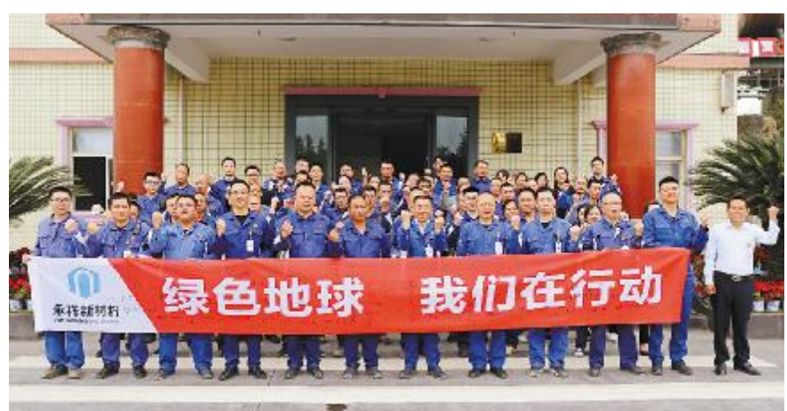
助力绿色地球,我们在行动