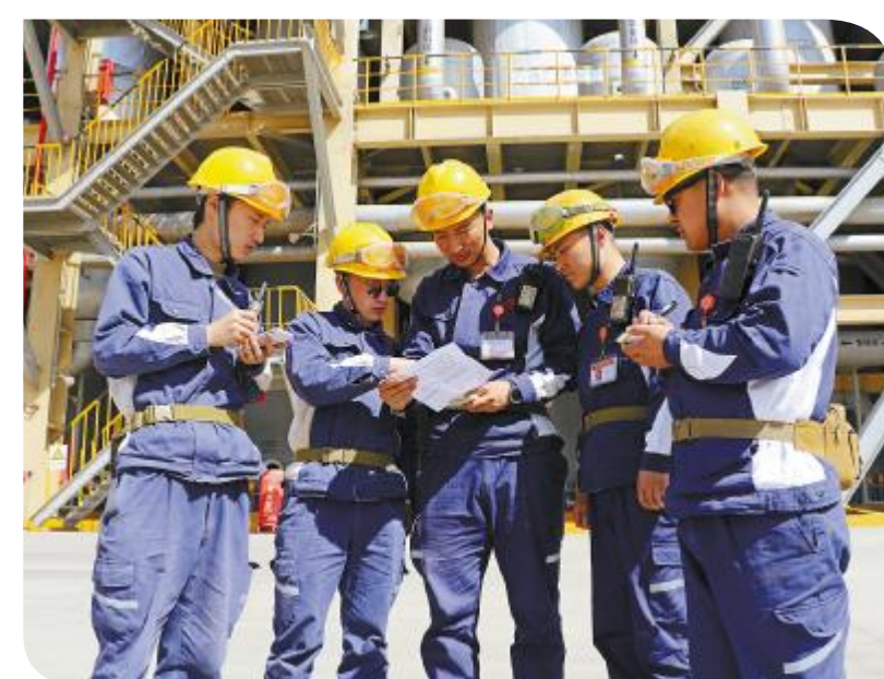
劳动竞赛中,内蒙古通威高纯晶硅一线班组开展讨论

永祥股份相关负责人表示,劳动竞赛以产量竞赛、质量竞赛为导向,广泛组织开展了以生产为主的劳动者竞赛活动,为全面实现公司量、利新增长,筑牢世界级高纯晶硅龙头企业营造了良好的工作氛围和工作环境。