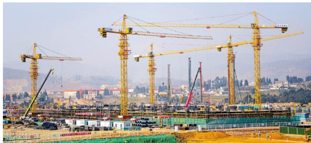
云南通威高纯晶硅项目建设如火如荼

4月,永祥股份各新项目建设如火如荼。永祥新能源二期严格按照通威集团董事局刘汉元主席“再铸精品工程”的要求,以“五个全新”思路,全力打造精品工程,一座“智慧工厂”正在崛起;云南通威高纯晶硅项目按计划有序推进,全体干部员工牢记刘主席“风清气正,打造精品工程”的嘱托,按照段董“五个全新”的理念,在通威文化的感召下,始终抱着“投产即达标、三个月即达产”的目标全力以赴,确保年底建成投产,再造行业新标杆。