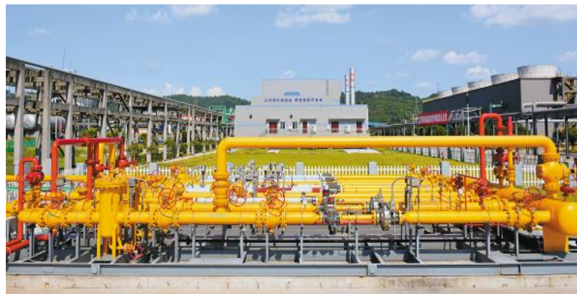
永祥早在2017年就实施了锅炉的煤改气改造,实现同等用能条件下碳排放的大幅度降低

作为全球农业和光伏行业龙头企业,通威集团在年初宣布全面启动碳中和规划,推动公司绿色低碳发展,并计划于2023年前实现碳中和目标。永祥股份积极响应国家和通威集团号召,进一步开展节能减排、降低消耗,大量使用推广节能设备、技术和使用清洁能源,实现安全绿色高质量发展,获得政府、社会、行业的高度认可,先后荣获国家“绿色工厂”、“绿色设计产品”、践行企业责任推进绿色发展、环境社会责任企业、四川省绿色经营百佳民营企业、节能减排先锋企业、产品碳足迹认证等诸多荣誉。