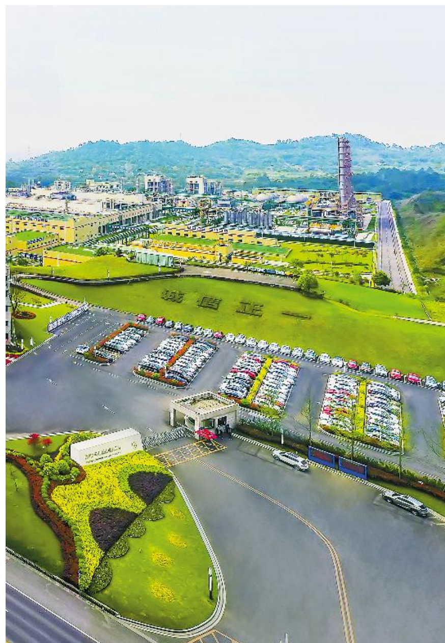
永祥股份绿色工厂

据了解,永祥碳中和工作小组工作目标是前期对公司碳排放情况摸底的基础上,通过工作组对公司各个碳排放领域的减排潜力、减排成本分析,提出各领域切实可行的碳减排方案,最终形成永祥板块的碳中和规划和碳减排实施方案。预计在今年7月31日前完成减排目标制定;8月31日前完成碳中和标准制定;9月31日前完成永祥碳中和规划。