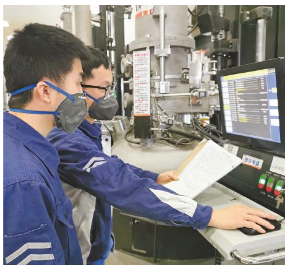
做好“师带徒”,为新项目储备人才添砖加瓦