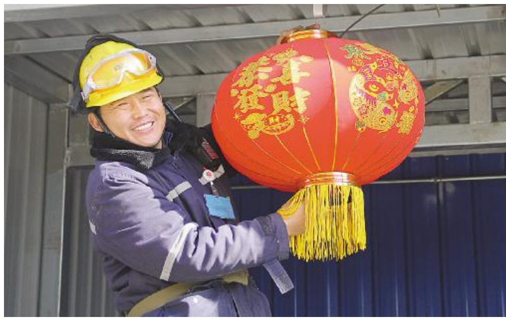
大红灯笼高高挂,春到、福到、好运到,我在内蒙古通威高纯晶硅给您拜年