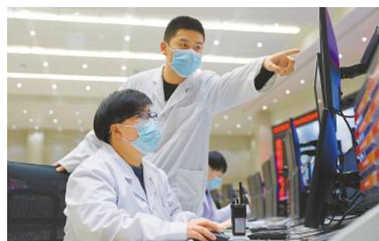
假期也要教好“徒弟”,让他技能快速提升