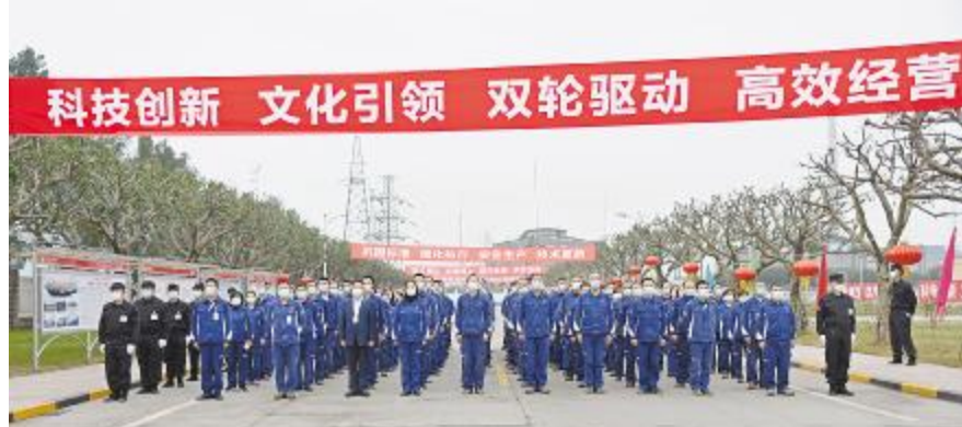
永祥树脂2021年生产经营动员大会现场