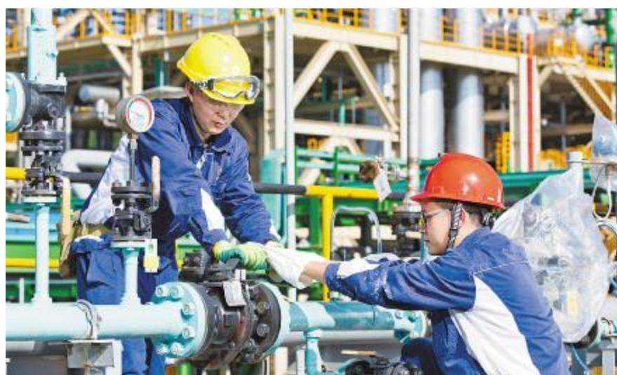
永祥员工在工作中精益求精,确保装置稳定运行

2021年,永祥将以“标准、平面、视频、渠道、根基”为文化建设关键词。标准:三大基地,文化归一。要求月月有主题,按照月度模板归类,在体现永祥板块整齐划一的文化氛围情况下,各公司适度创新;平面:塑造“一个IP”。在永祥阿米巴经营哲学基础上,梳理、应用好永祥VI体系,衍生永祥文创;视频:实施双管齐下。一方面以功能性广告片呈现;一方面以更接地气的方式,夯实基础。提升永祥整体形象,提高影响力,为人才引进助力;渠道:拓展传播途径。多方位,多创意,年轻化地