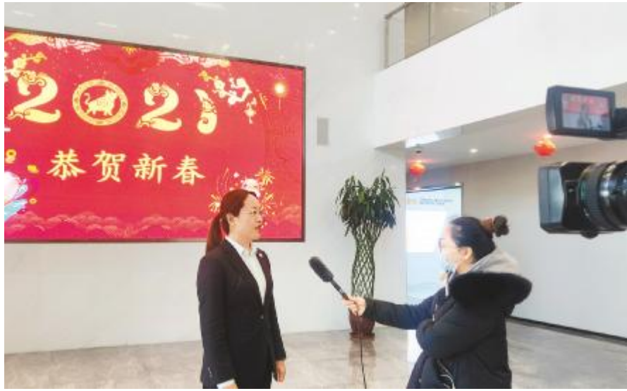
主流媒体聚焦内蒙古通威高纯晶硅“就地过年”暖心举措

2月,永祥股份四川乐山、内蒙古包头两大高纯晶硅基地保持安全、高效运行,云南保山高纯晶硅基地项目建设如火如荼,得到了社会、媒体的高度关注。《人民日报》、新华社、《内蒙古日报》《包头日报》《包头晚报》等媒体《就地过年待春归》栏目专题聚焦内蒙古通威高纯晶硅员工坚守岗位就地过年;《乐山日报》两次聚焦永祥乐山高纯晶硅新项目建设及春节坚守岗位,给予了永祥发展成绩高度肯定。