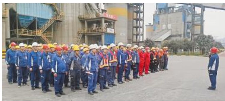
永祥新材料年度检修安全大会现场

通讯员 杨彦超 潘爱原 刘召伦 周海容 宁波 田晨怡 车双雨 孔祥晨 侯永峰 林心喻