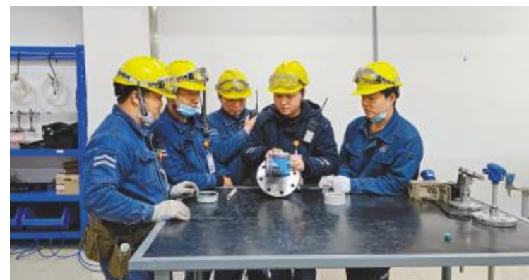
不放过任何一个机会,用心学习和交流,春节分享最快乐