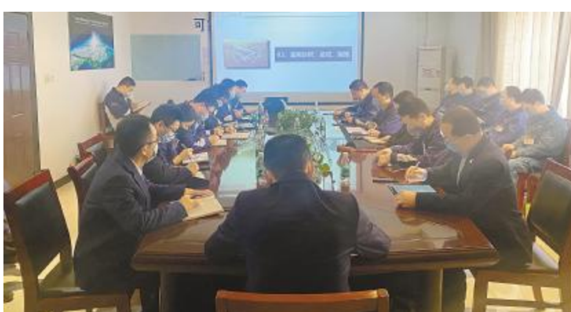
永祥硅材料、永祥光伏科技召开生产管理提升专题会