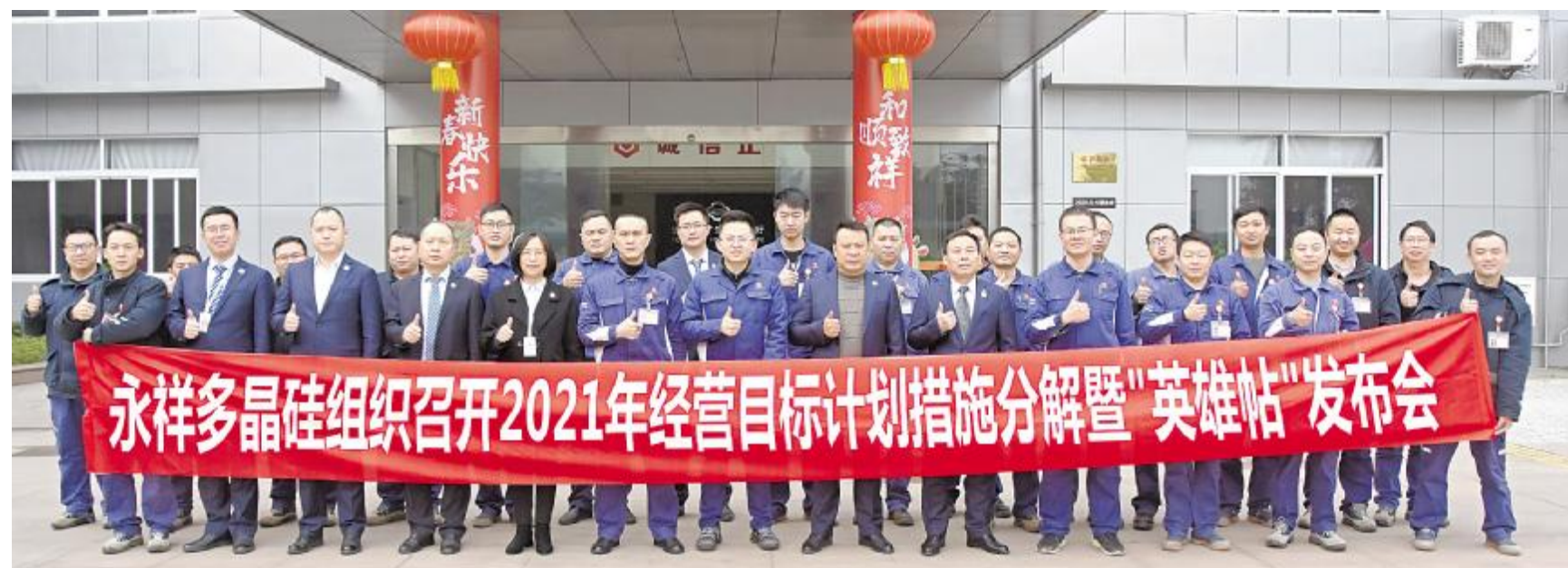
永祥多晶硅 2021 年经营目标计划措施分解暨“英雄帖”发布会合影

2月,永祥股份各基地、各公司在顺利保障春节期间安全稳定生产、新项目安全有序建设后,迅速调整状态,全面推进新一年的各项工作。永祥新能源、内蒙古通威高纯晶硅领导发挥表率作用,带队深入一线开展检查,强化安全管理;永祥硅材料、云南通威高纯晶硅节后立即召开收心会,动员全体员工立即进入状态,以良好的精神面貌投入到工作;永祥多晶硅发布“英雄帖”,凝聚力量,迎接挑战;永祥树脂明确管理提升方向,稳产增效,创新超越;永祥新材料按计划推进大修,做好各项保障工作。