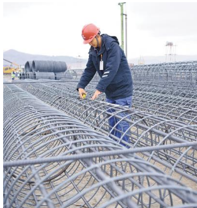
永祥员工严把工程施工质量关