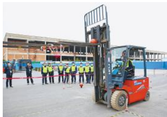
通威太阳能合肥公司叉车技能竞赛现场

2020年,通威太阳能将用“通威速度”、“通威效率”攻坚克难,用只争朝夕的精神描绘“通威画卷”,心怀希望、激情满怀,勇担责任、脚踏实地,敢想敢闯、敢干敢拼。继续大力弘扬工匠精神,着力打造一流的通威太阳能专业技能队伍,以更加坚决的执行力,不畏挫折压力,敢于拿下山头,不断追求卓越,一路向前,为打造成为世界级清洁能源企业而努力奋斗!