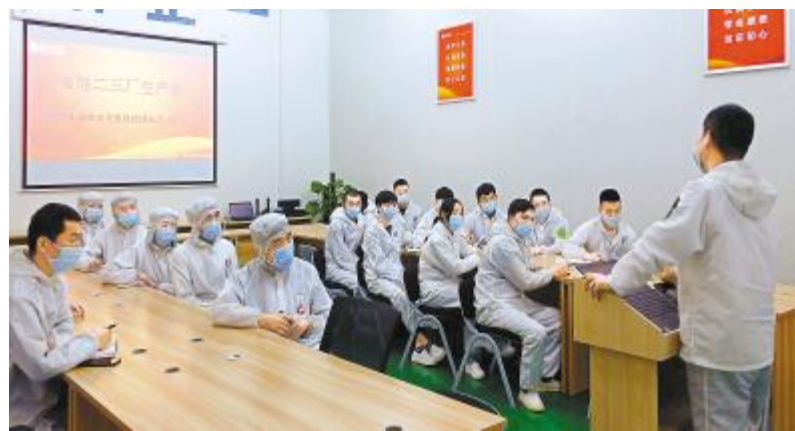
合肥公司生产体系员工开展“贯彻刘汉元主席讲话精神”主题学习沙龙现场

就是每一个员工都以公司的利益为出发点,坚决执行公司的每一项决策,严格执行公司的制度、流程,服务好内部客户,巩固竞争优势,确保领先地位的重要意义。正如在通威太阳能学习刘主席讲话的专题学习会上,谢毅董事长指出的那样:公司各部门要以问题为导向,树立全局意识,解决问题或者推动问题解决,通过领悟刘主席讲话,学习好主人经验,通威太阳能全体员工要振奋精神、高效执行,助力公司持续高质量发展! 以谢毅董事长的深刻解读为指引方向,通威大学光伏学院将持续深化公司企业文化建设工作,不断创新企业文化建设模式,助力各体系持续开展以执行力为核心指导思想的2020年度企业文化建设,并指导和督促各部门设计快速推动工作的计划和监督方式,以实现公司提升效能,平稳度过市场危机,持续行业领先。