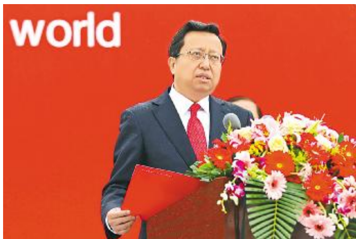
眉山市委书记慕新海致辞

甘孜州委书记刘成鸣致辞表示,近年来,甘眉两地坚持“一家亲”的地域观、“一盘棋”的大局观、“一体化”的发展观和“一条船”的奋进观,携手将甘眉工业园区打造成全省藏区经济体量最大的飞地园区。高效晶硅电池项目落户甘眉工业园区,必将为甘眉工业园区进一步做大经济总量,打造飞地园区新样板产生积极而深远的影响。相信在省委、省政府的坚强领导下,在两地干部群众的务实拼搏下,在通威的主动作为下,在社会各方的倾情支持下,甘眉园区必将为助推藏区同步奔康、实现民族团结进步和共同繁荣发展增添新的活力和动力!