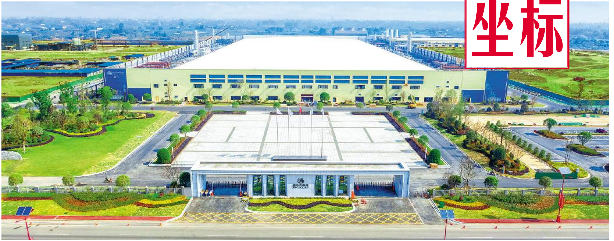
通威太阳能眉山公司厂区