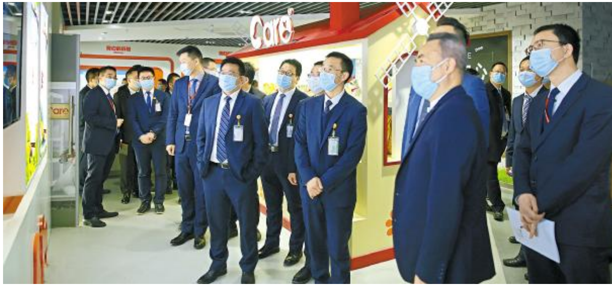
通威太阳能中高管团队走进好主人公司