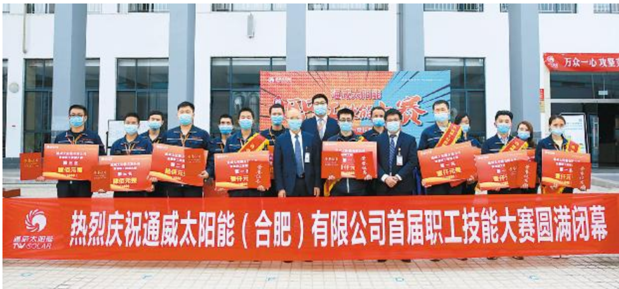
通威太阳能合肥公司首届职工技能大赛暨最美工匠选拔赛颁奖仪式现场