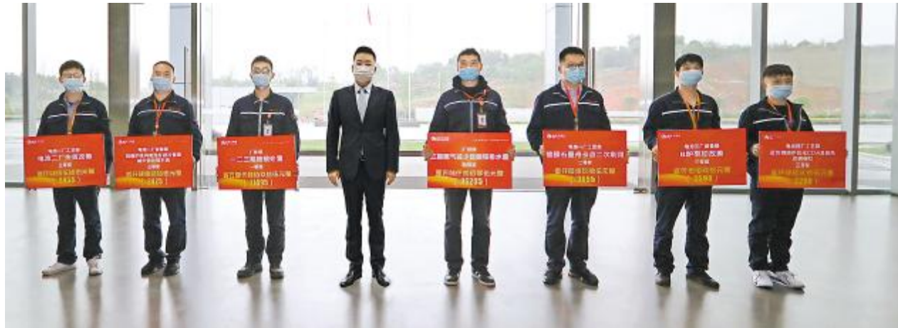
通威太阳能成都公司第一季度TQM颁奖仪式现场