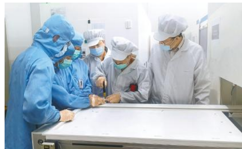
通威太阳能成都公司开展现场设备本质安全排查

为了让湖北籍员工安全、健康返岗,公司为返岗员工安排了独立的单人单间进行为期7天的隔离,由行政部门提供送餐、消毒等服务,并为每位员工进行了前后两次核酸检测,检测无异常后再正式返岗上班,全方位保障返岗员工的身心健康。一直以来,通威太阳能始终致力于奋斗者关爱活动,未来将继续尽最大努力,解员工之难,暖员工之心,让每一位通威奋斗者感受到家的温暖。