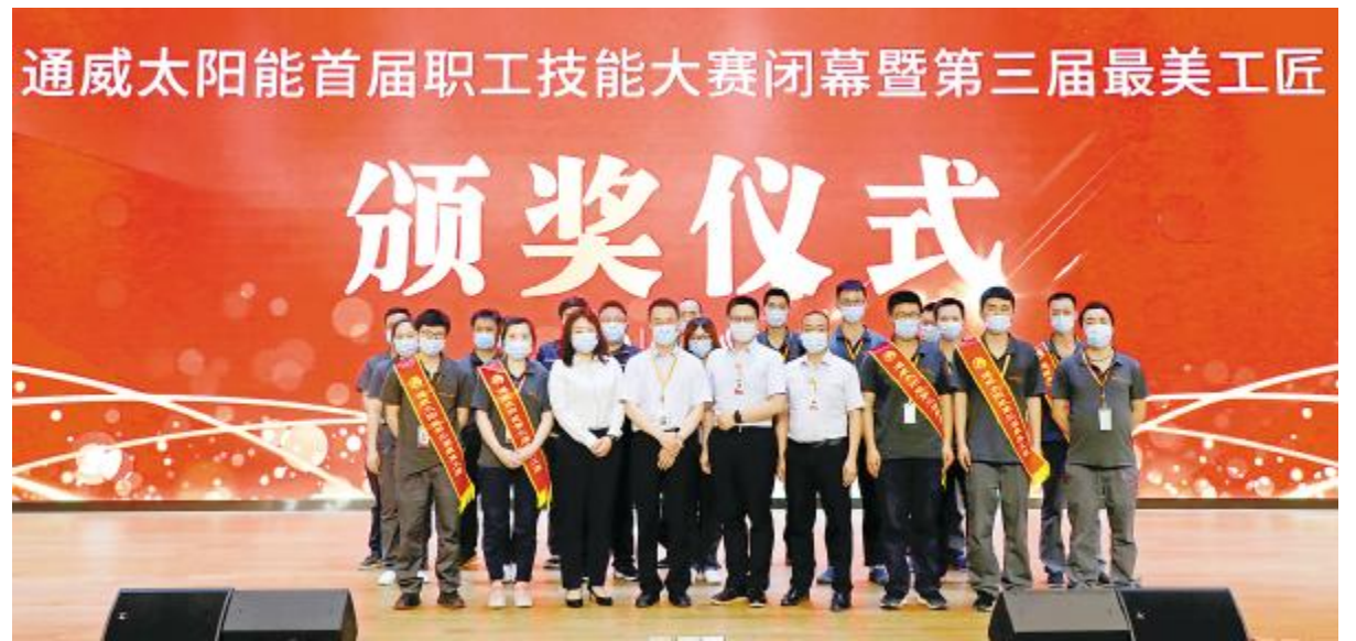
通威太阳能成都公司首届职工技能大赛暨最美工匠选拔赛颁奖仪式现场