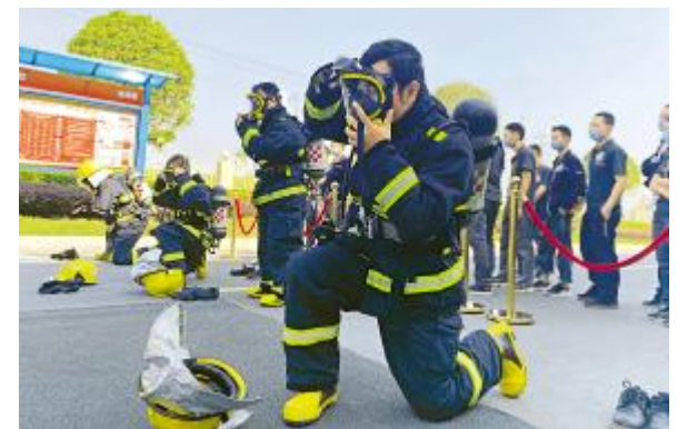
通威太阳能成都公司消防技能竞赛现场