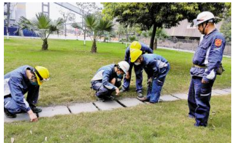
永祥新材料开展防汛防讯专项检查

根据公司实际生产经营特点,检查前编制《防汛防讯专项检查清单》并于3月24日,组织各工段负责人按照清单内容对河堤堤坎、公司厂房及构筑物、排水沟、水浸风险较大场所、重点区域与设施、道路堆场、防汛物资等进行认真排查,对检查发现的隐患汇总编制下发了《防汛防讯专项检查通报》,明确了整改要求和内容,落实责任人限期整改。同时要求各工段须加强对重点区域、特殊设备的防护,对防汛设施设备、排洪沟渠及时进行维护、疏通,做好雨季生产的方案组织和防汛应急演练,确保雨季汛期人员和设备安全。