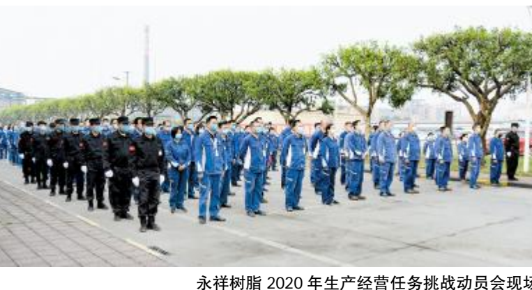
永祥树脂2020年生产经营任务挑战动员会现场