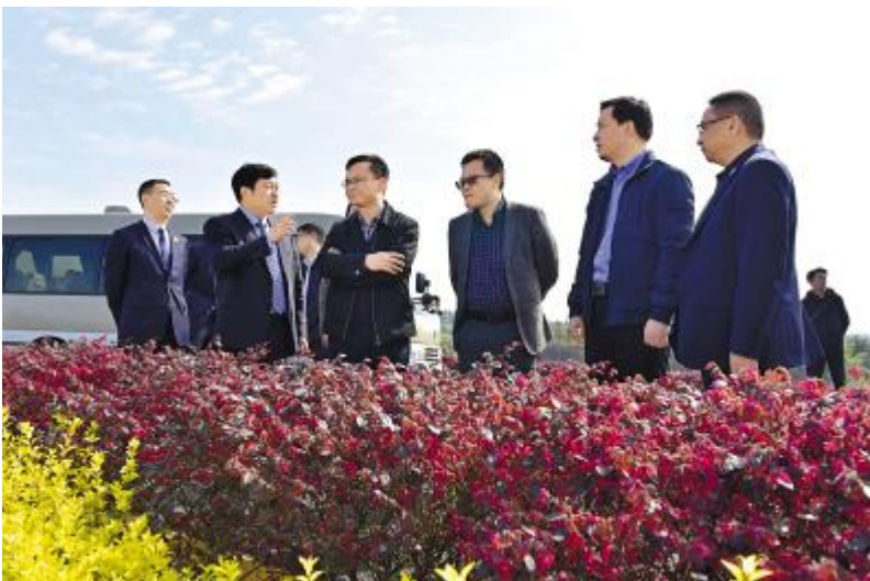
调研组详细了解永祥防疫工作和复工复产情况

在内蒙古通威高纯晶硅,调研组详细了解了公司在疫情期间的安全生产和防疫措施,袁总汇报了相关工作,并表示,疫情期间,自治区、包头市及昆都仑区各级政府领导多次亲临公司指导疫情防控,帮助落实国家税费减免相关政策,公司积极履行责任,做到疫情防控、安全生产“两手抓,两不误”。通过实地调研和听取汇报,调研组对公司的行业竞争力、发展规划、经营模式给予肯定,并表示,政府相关部门将助力企业发展。希望内蒙古通威高纯晶硅未来的发展越来越好,为当地经济社会发展作出更多、更大的贡献。