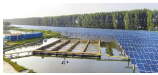
通威扬中“渔光一体”基地

扬中基地各品种成鱼养殖基本达到年初预计产量,特种养殖探索获得初步成功,但本年度草鱼青鱼鲫鱼均受到较为严重的疾病困扰,造成较多的损失。12月基地会积极联系市场,争取取得最后胜利。