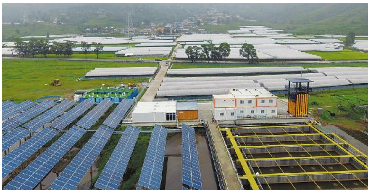
通威西昌“渔光一体”基地