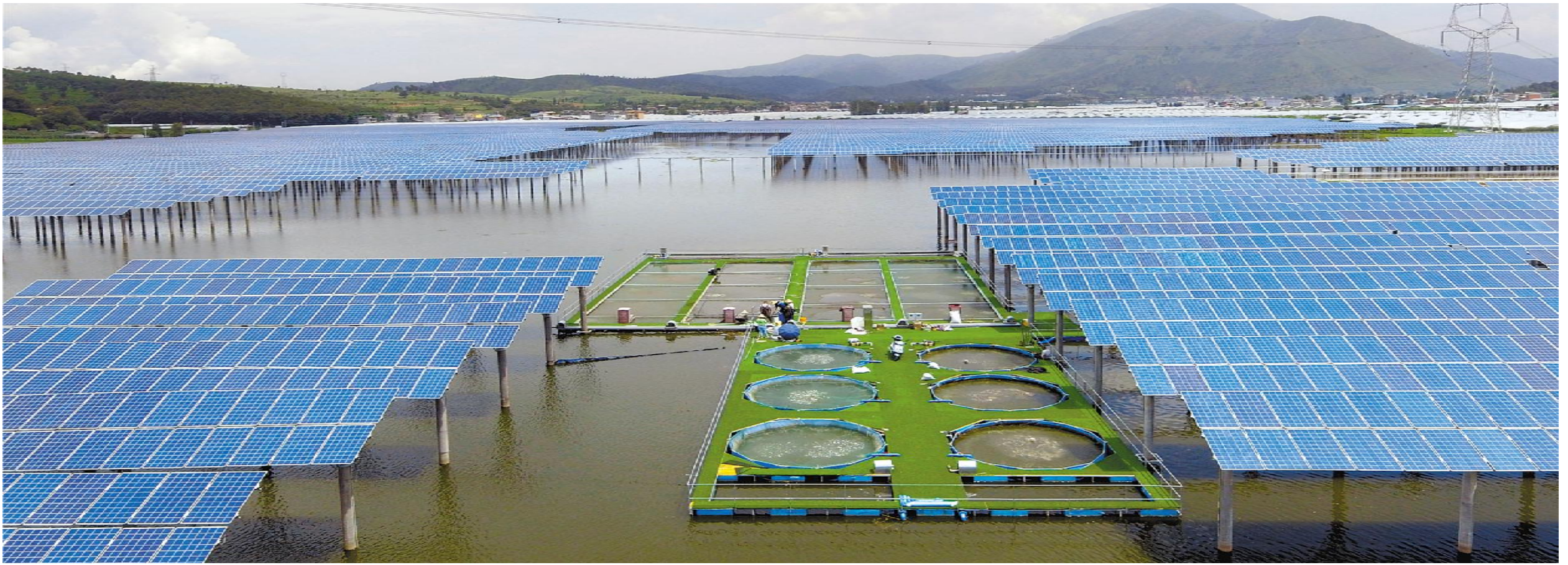
通威西昌“渔光一体”基地