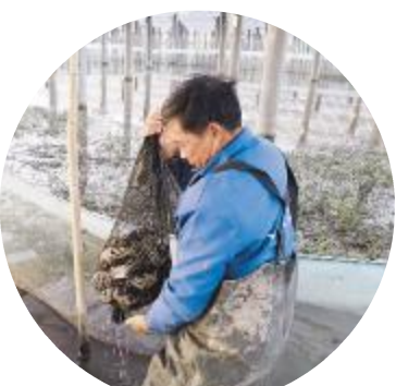
收集地笼里的螃蟹