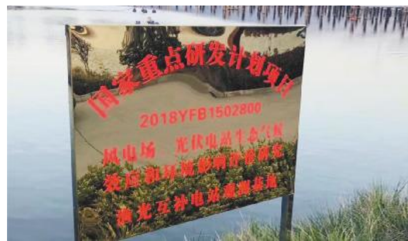
通威扬中“渔光一体”参与国家重点研发计划项目

现代渔业365模式,通过智能化的设施设备,生态湿地园区建设,形成了“水上发电、水下养殖、水边休闲”、“一种资源、三个产业”的集约发展模式,构建水产养殖、光伏发电、观光旅游一、二、三产业的有机融合。2019年,为进一步提升养殖效益,实现水产养殖行业的提档升级,扬中项目采用了“跑道养鱼”设施化渔业养殖模式,配套供水、推水等装置,实现水产养殖的自动化、智能化。相比传统养殖模式,设施化渔业养殖单位面积内载鱼量更大,由于采取了新的管理模式以及智能化、自动化的设备,养殖人员在中控室甚至手机上就能完成增氧、投饵等一系列工作。