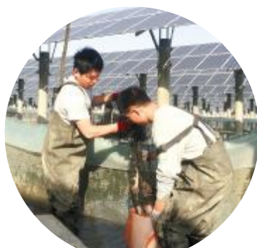
在光伏区收集螃蟹

11月18日,将采集统一池塘的河蟹,分光伏区、非光伏区和网围外的河蟹三个部分。解剖后,计算它的出肉率,性腺指数和肝胰腺指数。将来分别测定这三个部分的蛋白和脂肪含量,肌肉氨基酸含量和各个组织的脂肪和脂肪酶含量。