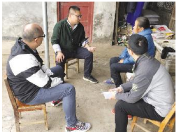
考察团队走访常德项目周边渔民