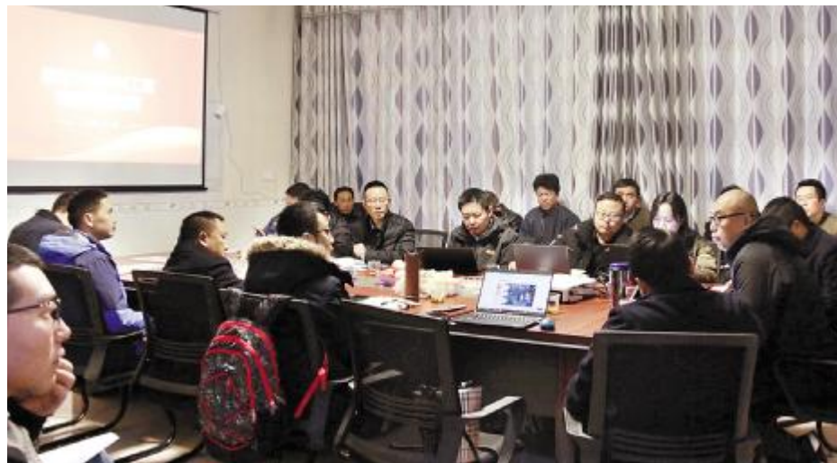
“渔光一体”标准化推进方案宣讲