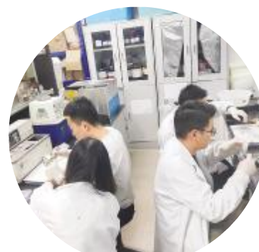
赴上海海洋大学检测产指标