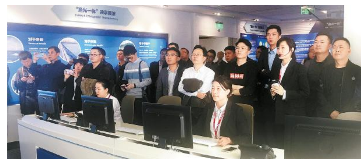
“云行天府”考察团参观通威“渔光一体”智能运营中心

参观通威太阳能成都公司期间,通威太阳能信息部分享了通威太阳能智能制造项目的背景,利用智能制造技术、大数据技术的具体方案以及项目取得的成效。目前,已计划在3年内完成智能工厂的建设,使其成为以信息物理系统为基础的集工程、生产、供应链三维一体的顾客、工厂、供应商紧密融合型智能工厂。在生产设施设备上,通威提高了国产化率,摆脱对外国设备、技术的依赖,并自建MES(制造企业生产过程执行管理系统),尽量打通工厂各环节、设备间的“数据孤岛”。